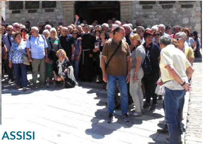
RICORDI DA ASSISI