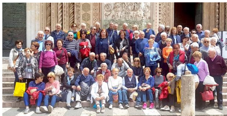
Raduno Orvieto 25-05-2019