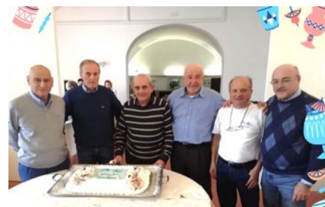
Gita a Larderello 23-06-2019