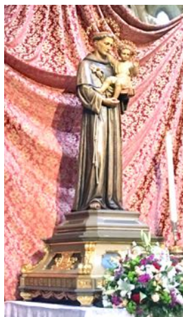
L'Anse nella città di Sant'Antonio durante la Manifestazione Nazionale del 29 maggio - 2 giugno, alla quale hanno partecipato numerosi soci della nostra Sezione