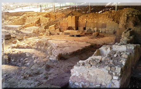
Terme Etrusche Romane del Bagnone