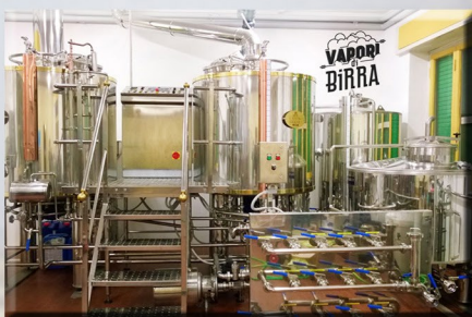
Birrificio Vapori di Birra