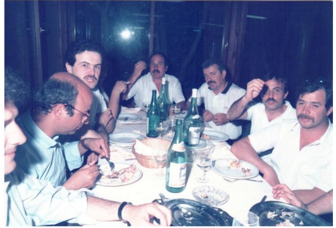
Sopra: Foto storiche delle cene dei colleghi della centrale di Piombino - Sotto: Foto degli amici al pranzo di Natale: a Follonica il 1 Dicembre; a Cecina il 30 Novembre; a Grosseto il 24 Novembre. – Poi - Il sindaco di Montieri e la musica nella cava di Gerfalco offerta da Enel Green