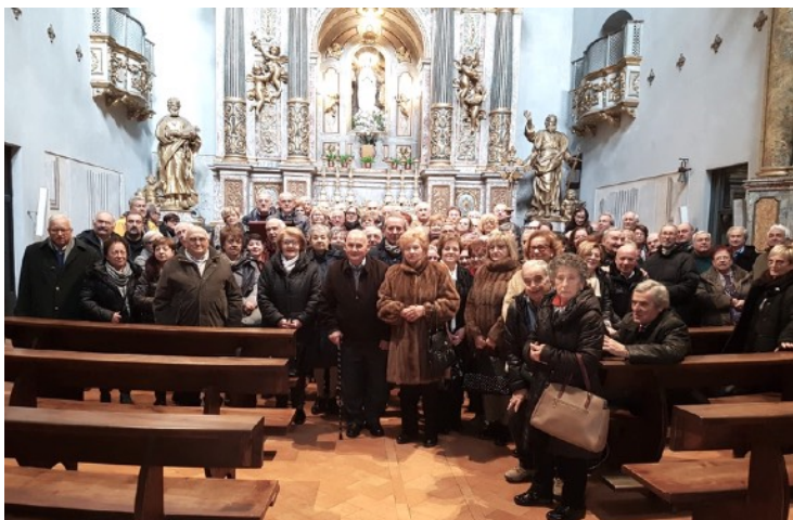
Convivio annuale dei soci dell'Umbria ad Assisi