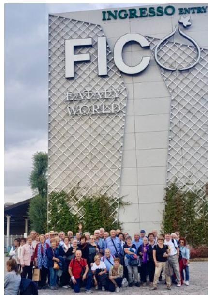
Gita a Bologna: FICO, parco tematico dedicato al settore agroalimentare e alla gastronomia, situato negli ex spazi del Centro agroalimentare di Bologna