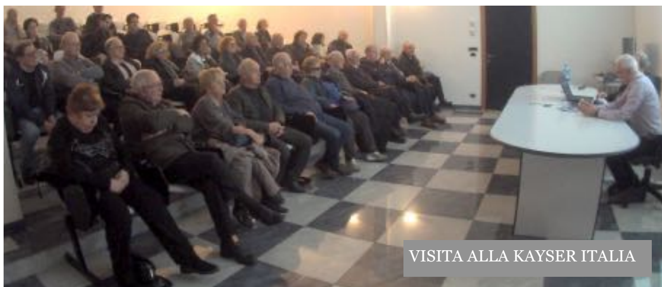
VISITA ALLA KAYSER ITALIA