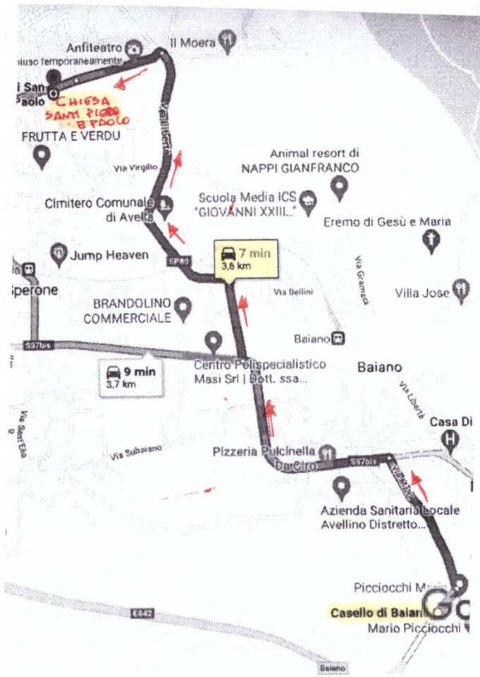
ITINERARIO CASELLO BAIANO CHIESA SAN PIETRO