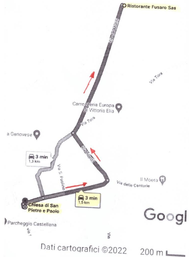
ITINERARIO DA CHIESA SAN PIETRO A RISTORANTE FUSARO