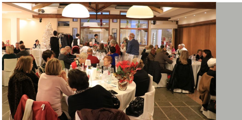
La sala del convivio

prossime festività e soddisfazione di tutti i presenti.