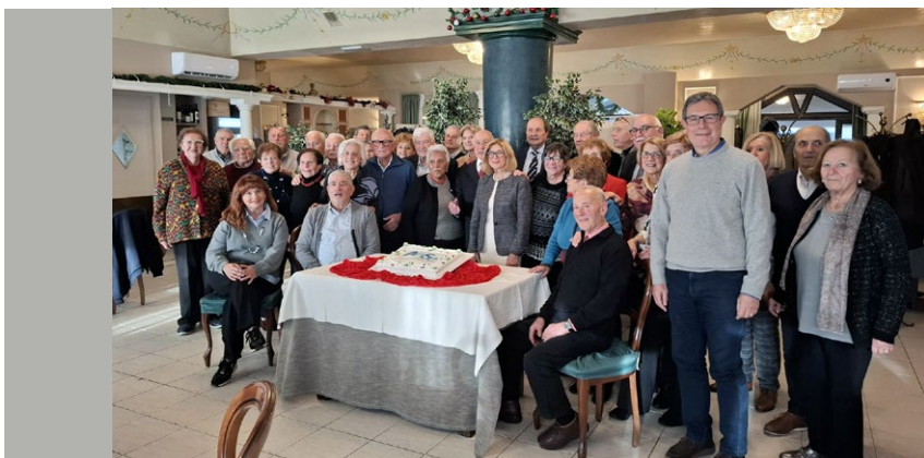
➤ Un'occasione per ritrovarsi attorno alla stessa tavola e creare nuovi ricordi

to: l'ottimo cibo e le tavolate vive di conversazioni, hanno fatto assaporare il rinnovato piacere semplice di ritrovarsi insieme, ancora una volta. Così l'inizio della giornata è stato particolarmente piacevole. L'atmosfera è stata rallegrata con musica e canzoni curate e interpreta-