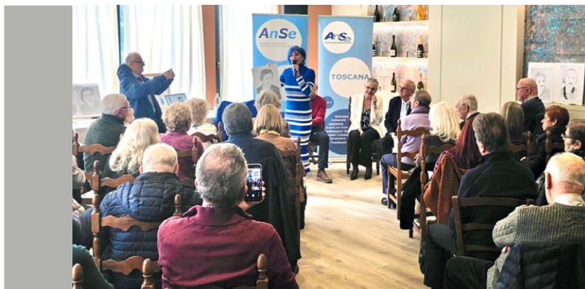
➤ La sala dell'Assemblea

La giornata si è conclusa con l'atteso pranzo conviviale a base di piatti della cucina locale.