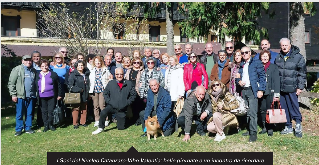
I Soci del Nucleo Catanzaro-Vibo Valentia: belle giornate e un incontro da ricordare

Il weekend si è concluso nel pomeriggio con il ringraziamento del Responsabile di Nucleo a tutti i partecipanti con l'arrivederci per gli auguri di Natale.