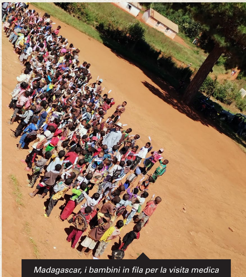
Madagascar, i bambini in fila per la visita medica

Guardando indietro, mi accorgo che quei sogni nati nell'infanzia hanno trovato strada passo dopo passo. I paesi possono essere lontani sulle mappe del mondo, separati da oceani e continenti. Eppure basta un incontro, uno sguardo, un gesto di condivisione per accorciare ogni distanza. Perché quando ci si avvicina davvero agli altri, si scopre che i cuori, in fondo, non sono mai così lontani.